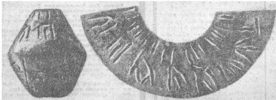
Фотографія лютізького пряслиця із газети «Молодь України»

У розв'язанні цієї проблеми вченим могли б допомогти краєзнавці, які мають у своїх домашніх колекціях старожитності з викарбуваними на них незрозумілими знаками. Автор статті просив би повідомити йому про такі речі.