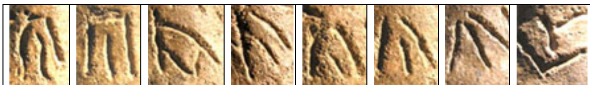
Знаки на лютізькому пряслиці

Газета «Молодь України», № 63 (12381), 31.03.1974.